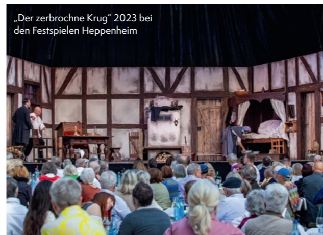
„Der zerbrochne Krug“ 2023 bei den Festspielen Heppenheim

Das Festival ist ein viertägiges Kunst- und Kulturfestival in Dahnsdorf. An fünf unterschied-