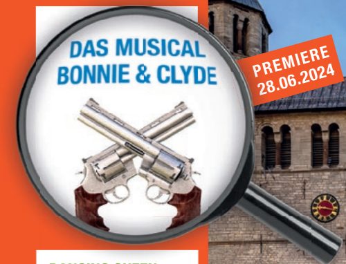
DAS MUSICAL BONNIE & CLYDE