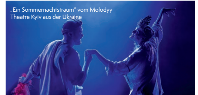
„Ein Sommernachtstraum“ vom Molodyy Theatre Kyiv aus der Ukraine