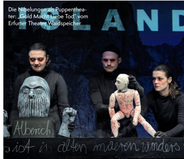
Die Nibelungen als Puppentheater: „Gold Macht Liebe Tod“ vom Erfurter Theater Waidspeicher

Die Raimundspiele Gutenstein sind eine Veranstaltungsreihe in Gutenstein in Niederösterreich, die seit 1993 jährlich während der Sommermonate stattfindet. Bis