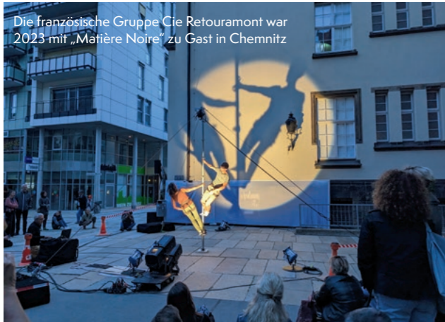
Die französische Gruppe Cie Retourmont war 2023 mit „Matière Noire“ zu Gast in Chemnitz