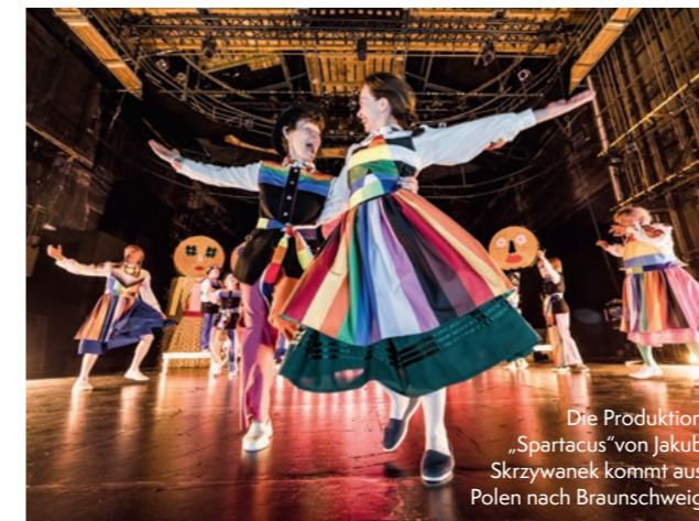
Die Produktion „Spartacus“ von Jakob Skrzywanek kommt aus Polen nach Braunschweig

Die Tradition der Münchner Opernfestspiele reicht bis in das Jahr 1875 zurück, als zum ersten Mal ein „Festlicher Sommer“ veranstaltet wurde. www.staatsoper.de/festspiele