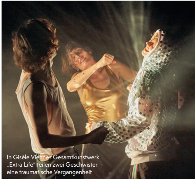
In Gisèle Viennes' Gesamtkunstwerk „Extra Life“ teilen zwei Geschwister eine traumatische Vergangenheit