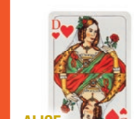
ALICE IM WUNDERLAND