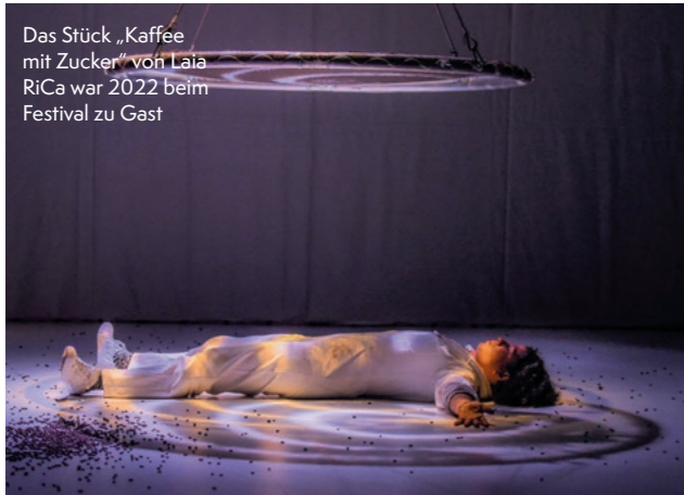
Das Stück „Kaffee mit Zucker“ von Laia RiCa war 2022 beim Festival zu Gast