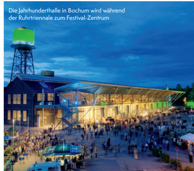
Die Jahrhunderthalle in Bochum wird während der Ruhrtriennale zum Festival-Zentrum

Das größte Kulturfestival in der europäischen Bäderregion bietet über 300 Veranstaltungen in Bad Elster sowie in rund 40 Spielorten der Vierlandregion. www.chursaechsische.de/veranstaltungen/chursaechsischer-sommer