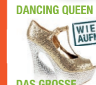
DANCING QUEEN WIEDER-AUFNAHME