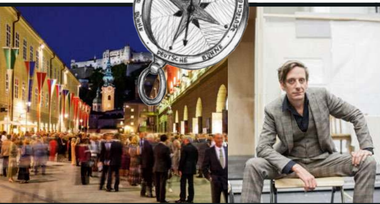
Alle Jahre wieder: vor dem Festspielhaus in Salzburg