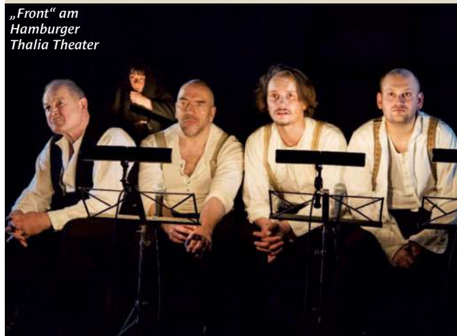
„Front“ am Hamburger Thalia Theater

KRIEG IM THEATER: Der Krieg scheint immer näher an unser friedliches Land heranzurücken. Dabei hatten sich die Theater schon länger auf das Gedenken an den Ersten Weltkrieg, der vor 100 Jahren begann, eingestellt. Zwischen Ukraine und Verdun blicken wir auf Krieg und Gewalt im Theater.