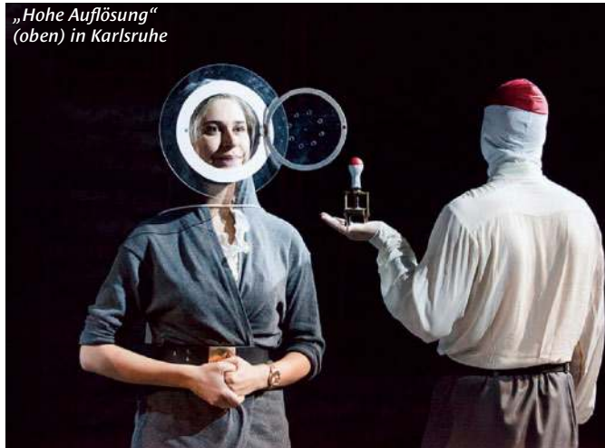
„Hohe Auflösung“ (oben) in Karlsruhe