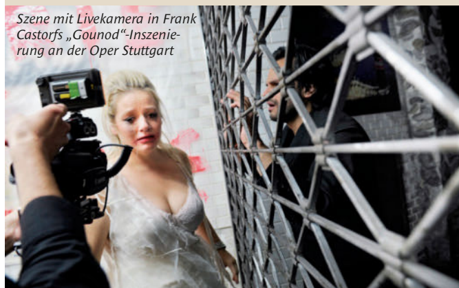
Szene mit Livekamera in Frank Castorfs „Gounod“-Inszenierung an der Oper Stuttgart